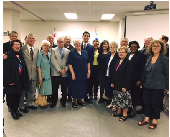
Les élus de l’arrondissement d’A-C, les Sœurs de la Providence et des représentants du CLIC et de ses membres suite à l’annonce lors du Conseil d’arrondissement du 13 juin 2016.

Selon Mme Fortin, « nous sommes toutefois encore loin du but. Beaucoup de travail reste à faire avant que l’on puisse s’y installer. L’aménagement des lieux, le partage des espaces, les coûts et la gouvernance ne sont que quelques-unes des questions que nous devons traiter. Une chose est sûre, nous nous efforcerons d’élaborer le projet tous ensemble, le CLIC, ses membres et l’arrondissement. »