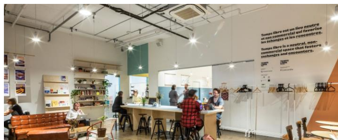
Un projet d'Espaces temps dans le Mile End : les espaces collaboratifs et de co working de la Coopérative de solidarité Temps libre

Par ailleurs, lors de sa dernière réunion, le comité Maison de quartier a discuté et choisi plusieurs critères devant encadrer l'intégration des futurs locataires dans la Maison. Une fois le travail complété, le comité fera des recommandations à l'arrondissement, qui prendra les décisions qui s'imposent. Enfin, le comité a reçu des représentants de l'organisme Espaces temps, qui pourrait potentiellement l'accompagner dans la planification et la conception des « Espaces citoyens ». Le comité attend une offre de services en bonne et due forme de la part de l'organisation avant d'arrêter sa décision. Une validation doit également être faite auprès de Centraide afin de s'assurer que le mandat d'Espaces temps soit couvert par le PIC (Projet Impact Collectif). À suivre.