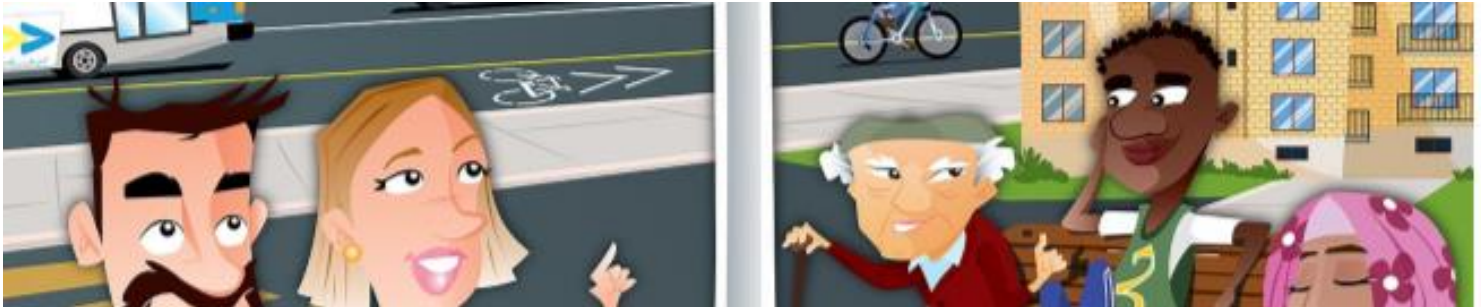
Extrait de l'illustration de la carte et du bottin des ressources publiques et communautaires de Bordeaux-Cartierville Illustration : Laurence Dechassey

Enfin, après un très dur labeur, la « Carte et bottin des ressources publiques et communautaires de Bordeaux-Cartierville » seront dévoilés lors d'un 5 à 7, le mardi 16 mai prochain. Surveillez votre boîte courriel pour tous les détails !