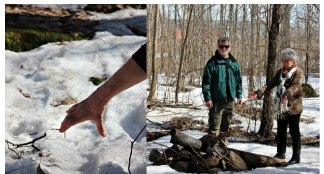
À gauche : une trace de « fat bike ». À droite : feu de camp improvisé au Bois-de-Saraguay Photos : Annie Gauthier, 3 avril 2017

Belle surprise lors de la rencontre d'information, tenue par le CLIC à la place de l'Acadie dimanche le 9 avril, en vue de la mise sur pied d'un nouveau comité citoyen : deux résidentes, une habitant dans un logement de l'OBNL Ressources Habitation de l'Ouest et l'autre dans un des condominiums du site, ont manifesté leur intérêt pour assumer le leadership de ce comité, dont le principal objectif tournerait autour du développement du sentiment d'appartenance des habitants de l'îlot.