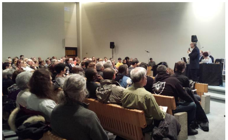
Soirée d'information de la Ville de Montréal sur les travaux Laurentien-Lachapelle Photo : CLIC, 6 avril 2017

Les responsables de la phase I du projet de réfection routière « Laurentien-Lachapelle » ont tenu une soirée d'information à l'intention des résidents et des commerçants touchés par ces travaux, jeudi le 6 avril dernier dans la magnifique chapelle de l'édifice des Sœurs de la Providence, lieu de la future Maison de quartier de B-C. La salle était bondée. Plus de 150 personnes ont écouté les présentateurs, venus expliquer la nature et le déroulement des travaux, ainsi que les mesures qui seront prises pour en atténuer les contrechocs. Si certains ont souligné l'apport positif de ce grand projet de réaménagement, d'autres, essentiellement des commerçants locaux, ont partagé leurs vives inquiétudes quant à l'impact des travaux et de la reconfiguration du secteur sur leur chiffre d'affaires. Cliquez ICI pour en savoir plus sur ce projet.