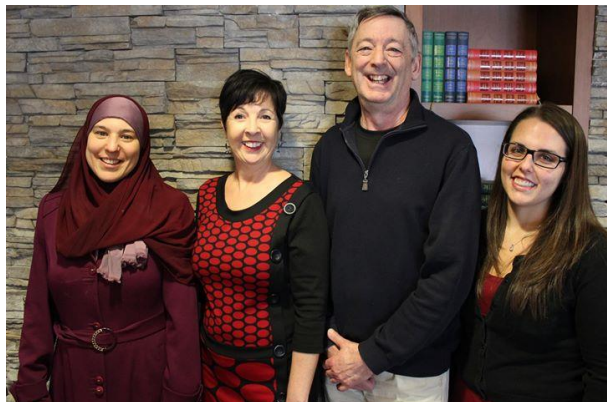
Rencontre préparatoire du CCDI à la résidence Rosalie Cadron Photo : CLIC, 24 mars 2017

Le CCDI (Comité Citoyen sur le Dialogue Interculturel) de B-C poursuit sa mission le 3 mai prochain en tenant une rencontre entre les aînés habitant au Manoir Gouin et à la résidence Rosalie-Cadron, et les personnes fréquentant le Centre communautaire Laurentien. L'histoire du