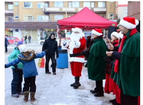
« La Magie de Noël sur Gouin Ouest. Photos : AGAGO, 10 décembre 2016

L'AGAGO (Association des Gens d'Affaires de Gouin Ouest) est satisfaite de la première édition de son marché de Noël extérieur, qui s'est tenue le 10 décembre sur la rue Ranger, tout près du boulevard Gouin. Quelques centaines de résidents