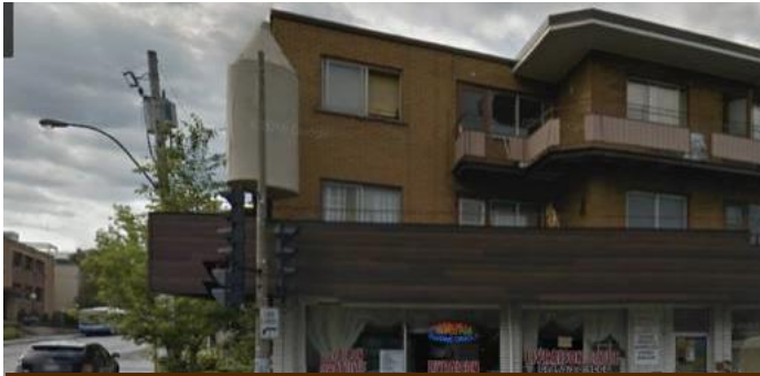
Ancienne enseigne commerciale Photo : Google Map, Septembre 2016

Le Comité de pilotage du projet Gouin Ouest : cœur de Cartierville a finalement retenu la proposition de l'artiste muraliste Olivier Bonnard pour le projet de revalorisation artistique de l'enseigne commerciale située sur Gouin près de la rue Grenet. M. Bonnard, qui a plusieurs réalisations impressionnantes à son actif, tant à Montréal qu'ailleurs dans le monde, a proposé une fresque colorée à caractère historique, qui deviendra assurément un point d'attraction dans Cartierville. L'œuvre devrait être complétée pour la fin juin 2017.