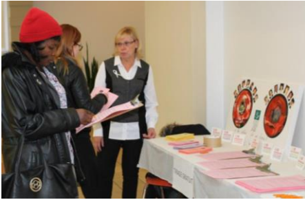
Campagne de sensibilisation dans le cadre des 12 jours d'action pour l'élimination de la violence faite aux femmes Photo : Concertation Femme, 30 novembre 2017

Le Comité Violence intrafamiliale a rejoint et sensibilisé 88 personnes lors de ses trois kiosques d'information et de sensibilisation les 24 novembre, 30 novembre et 1 er décembre derniers, dans le cadre de la « Campagne de 12 jours d'action pour l'élimination de la violence faite aux femmes ». Ces kiosques se tenaient aux Galeries Normandie, à la bibliothèque de Cartierville et au Centre communautaire de B-C. Aussi, un portfolio, à l'intention des intervenantes, contenant de la documentation sur la violence conjugale et intrafamiliale, est en préparation.