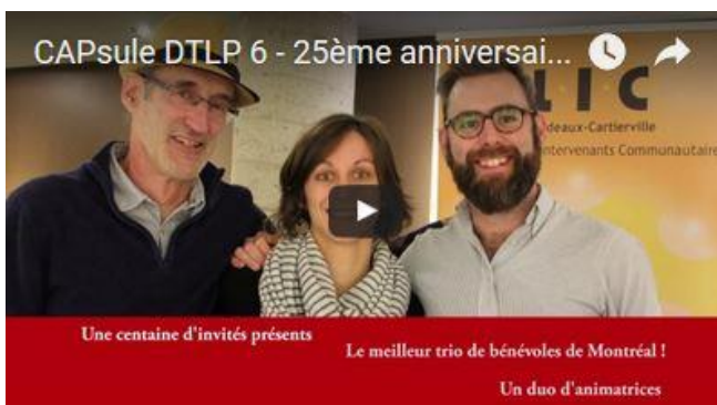
Photo de présentation de la CAPsule de tous les possibles 6, 25 ème anniversaire du CLIC, Janvier 2017