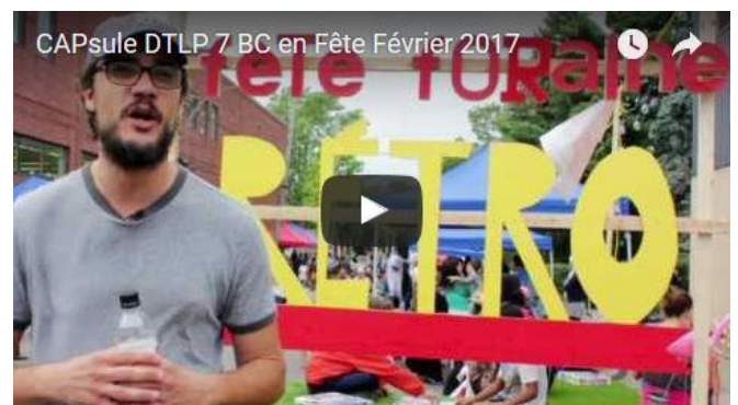
Photo de présentation de la CAPsule de tous les possibles 7, BC en Fête, Février 2017