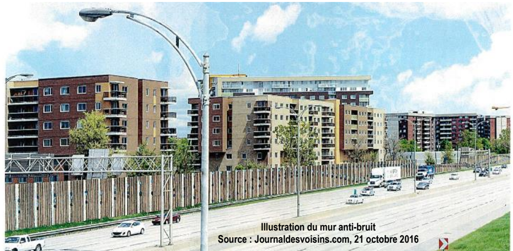
Illustration du mur anti-bruit

Les habitants de la place de l'Acadie devront patienter jusqu'au printemps 2017 avant de voir le bruit en provenance de l'autoroute 15 diminuer. En effet, de longs délais dans les réponses aux demandes d'autorisation d'occupation de terrains, nécessaire pour les travaux, ont retardé la construction de l'écran sonore, qui devait débuter à l'automne 2016.