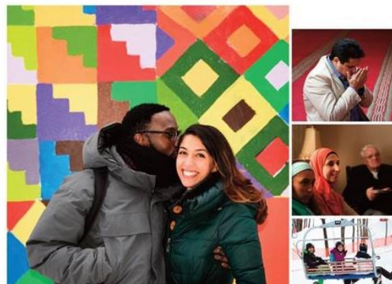
Extrait de l'affiche du photoreportage Octobre 2016

Du 22 octobre au 4 novembre 2016 Centre Communautaire Laurentien 12265, boulevard Laurentien, Montréal Tous les jours de 10 h à 12 h et de 18 h à 20 h