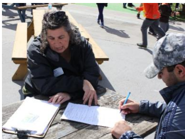
Sondage, place de l'Acadie Photo : CLIC, Septembre 2014

Lors de la fête de fin d'été du 24 septembre dernier à la place de l'Acadie, les partenaires ont interrogé les habitants de l'îlot sur ce qu'ils pensaient de leur