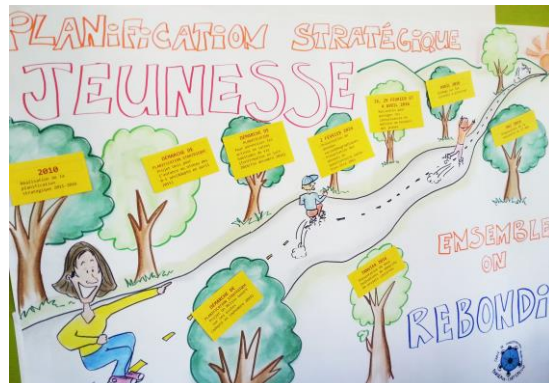
Journée de planification stratégique jeunesse Photo : Manon Boily, 17 mai 2016