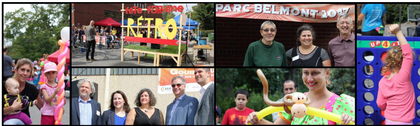
Fête foraine rétro sur Gouin Ouest du 17 septembre 2016

Le 17 septembre dernier, le CLIC, l'Association des Gens d'Affaires de Gouin Ouest (AGAGO) et BC en fête organisaient, dans le cadre du projet Gouin Ouest : cœur de Cartierville , une fête foraine rétro sur la rue Ranger, tout près du boulevard Gouin. L'événement, une première dans ce coin du quartier, a été un grand succès. Près de 400 personnes, de tous les horizons, y ont