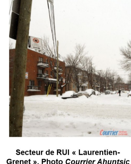
Secteur de RUI « Laurentien-Grenet ». Photo Courrier Ahuntsic et B-C. 2008